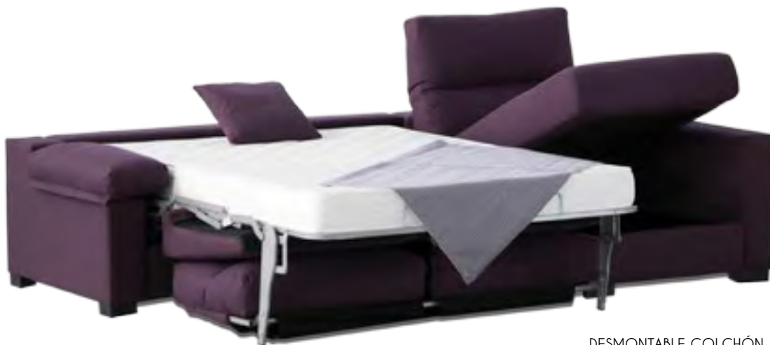
DESMONTABLE COLCHÓN 16