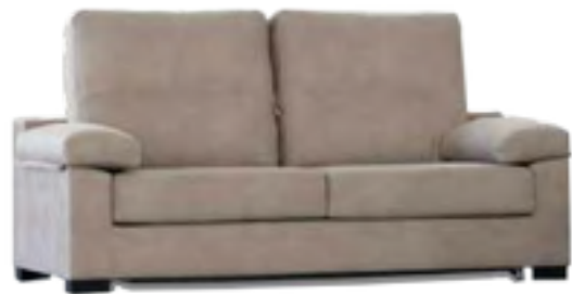
BASIC COLCHÓN 12