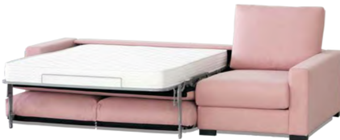
DESMONTABLE COLCHÓN 16