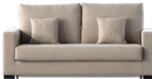
BASIC COLCHÓN 12