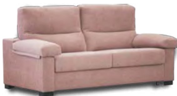
BASIC COLCHÓN 12