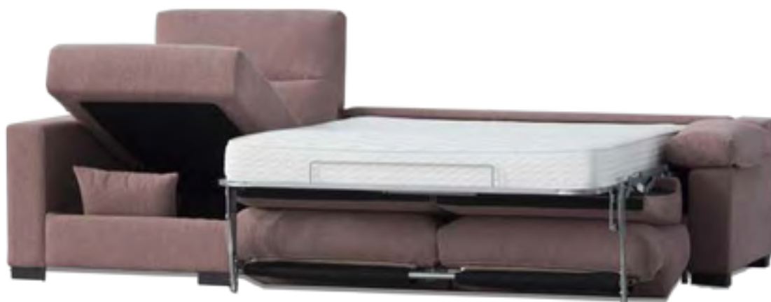
DESMONTABLE COLCHÓN 16