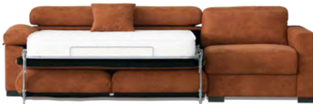
DESMONTABLE COLCHÓN 16