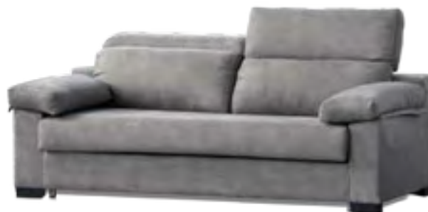
BASIC COLCHÓN 12