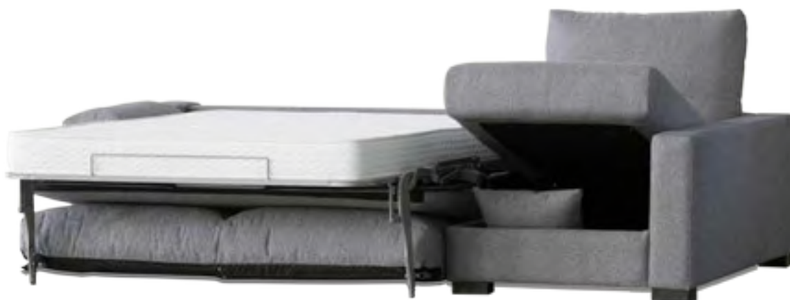
DESMONTABLE COLCHÓN 16