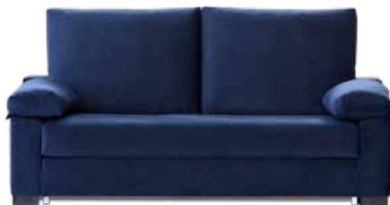
BASIC COLCHÓN 12