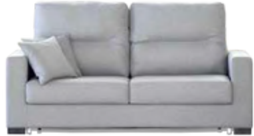
BASIC COLCHÓN 12