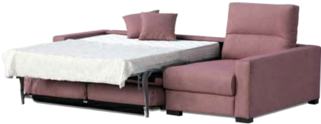
DESMONTABLE COLCHÓN 16