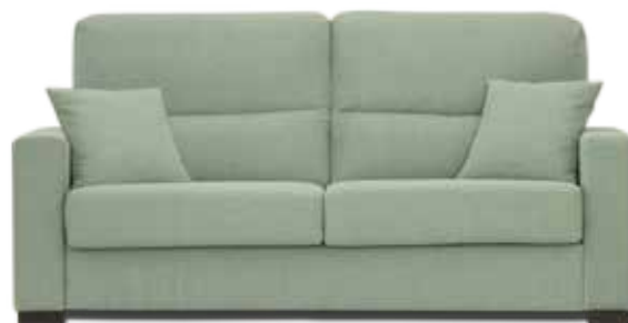
BASIC COLCHÓN 12