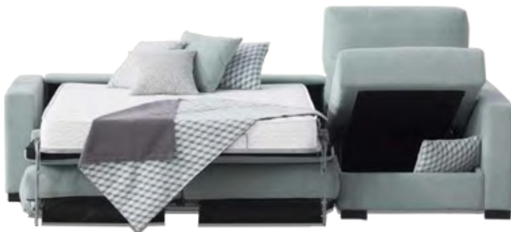
DESMONTABLE COLCHÓN 16