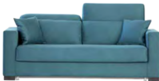
BASIC COLCHÓN 12