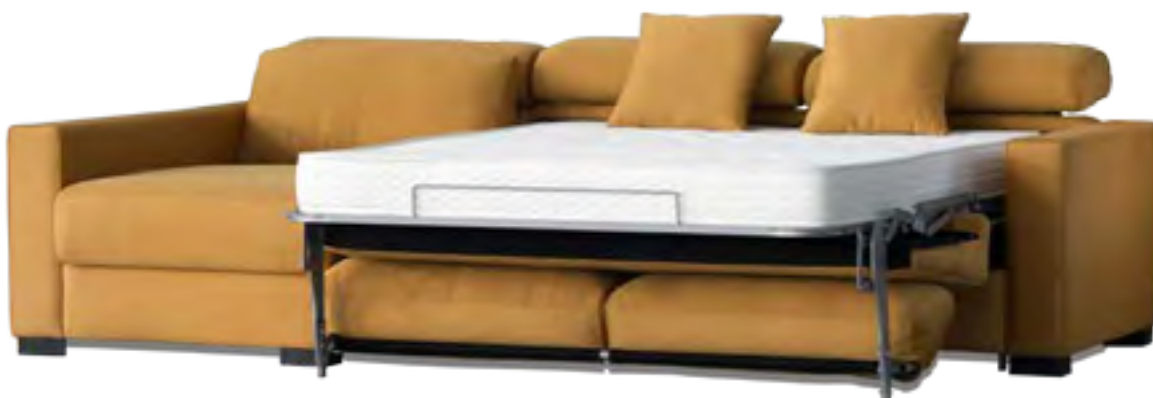
DESMONTABLE COLCHÓN 16